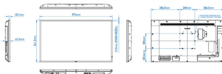
Philips 43BDL3510Q Verze: 1.0 Release Date: 2020/03/23