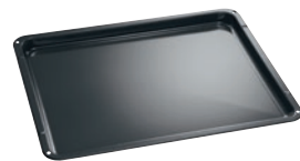
Plech na pečení Ideální na koláče a drobné pečivo. Model A4OZDT01