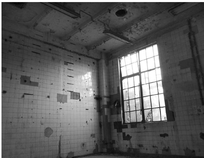
Temmlerovy závody v Berlíně-Johannisthalu dnes

kondenzátorech se spojitými trubkami a skleněnými chladiči vařili chemici svou dokonale čistou látku. Zde klapala víčka bachratých chemických baněk a se syčením vypouštěla horkou žlutočervenou páru, zatímco emulze praskaly a prsty v bílých rukavicích nastavovaly perkolátory. Vznikal zde metamfetamin — a sice takové kvality, jakou ve svých nejlepších časech nedokáže vyrobit ani smyšlený drogový kuchtík Walter White v americkém televizním seriálu Perníkový táta , který pervitin zpodobnil coby symbol naší doby.