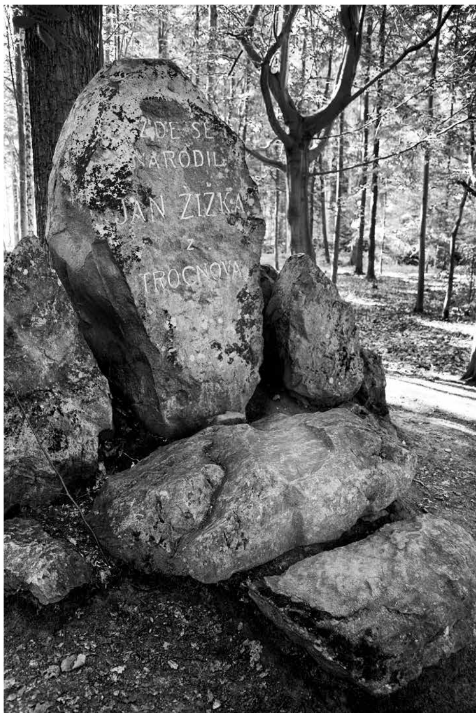
Žižkův trocnovský památník, vybudovaný roku 1908 na údajném místě vojevůdcevo narození.